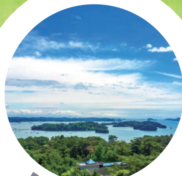
■ 日本三景 松島