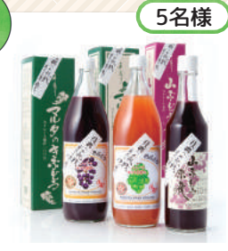
マルタの果汁工場 田所食品(株)