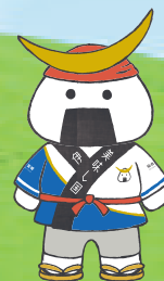
仙台・宮城観光PRキャラクター むすび丸