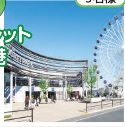
三井アウトレットパーク仙台港 提供