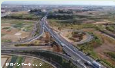
長町インターチェンジ