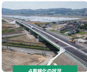
4車線化の状況 (吉田橋付近)