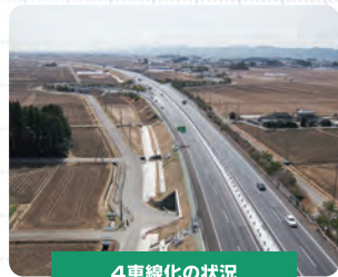
4車線化の状況 (亶理IC付近)