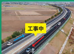
写真1:外々運用の現地状況

工事の影響で工事現場付近を走行する方々にはご不便、ご迷惑をお掛けしますが、ご理解、ご協力をお願いします。