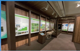
銚立ビジターセンター [F-2]

鳥海山の5合目にあり、写真やパネル等を使って鳥海山の成り立ち、生息動物や高山植物などを紹介している。