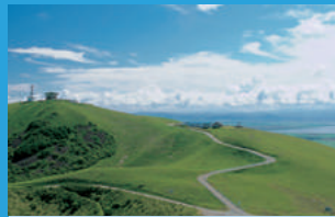
寒風山回転展望台 [C-1]

頂上からは一面が芝生で覆われた風景や、眼下に広がる街並みや海岸線など、360度の絶景を楽しむことができる。