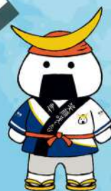
仙台・宮城観光PRキャラクター むすび丸