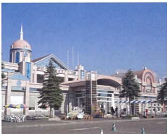
ハイウェイオアシス館

砂川ハイウェイオアシスは砂川SAと結ばれており、札幌方向、旭川方向、どちらの方向からもご利用できます。「砂川ハイウェイオアシス館」から「北海道子どもの国」に行くことができます。ハイウェイオアシス館については、下記のホームページでご確認ください。http://www.oasiskan.jp/